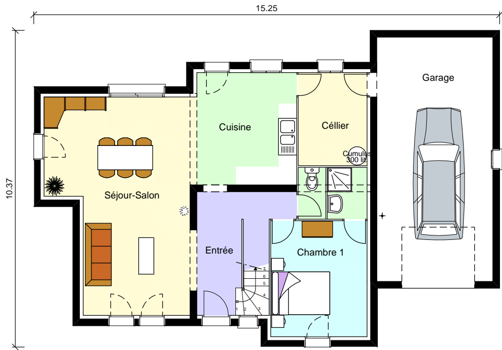
Plan du Rez De Chaussée